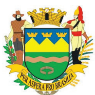
Câmara Municipal de Taubaté

Salve em sua lista de contatos o telefone do CIEE: 3003-2433 e mantenha seu cadastro atualizado no portal do CIEE ( https://web.ciee.org.br/login ) !