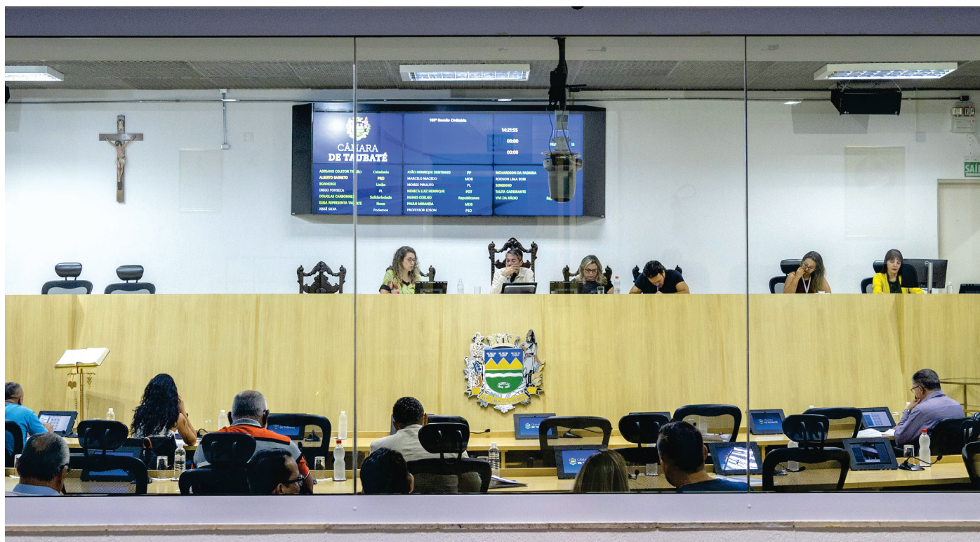
Vereadores no Plenário durante 158ª sessão, dia 12